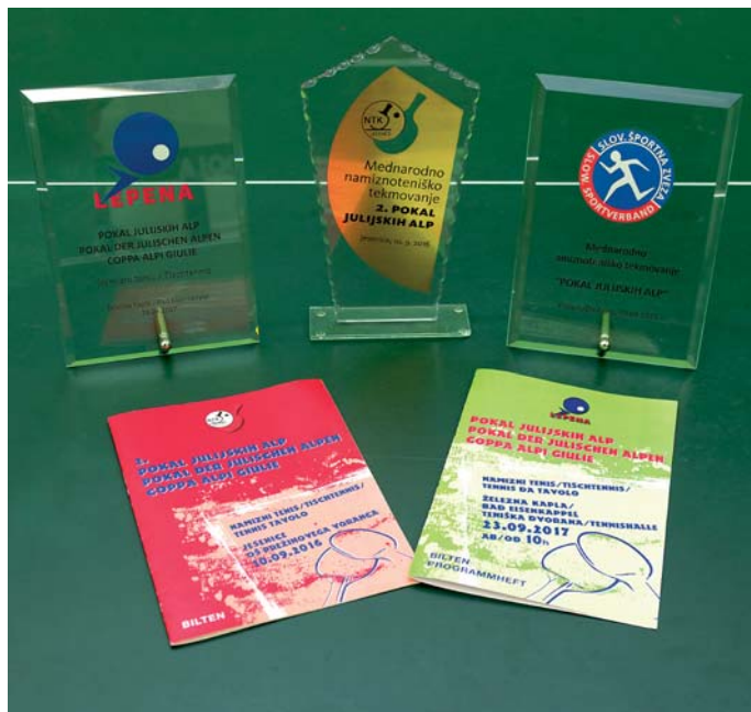
Publikacije in trofeje vseh treh Pokalov Julijskih Alp Die Publikationen und Trophäen aller drei Pokale der Julischen Alpen

Ob vsakem Pokalu Julijskih Alp je bil izdan Bilten. Vse ekipe so prejele spominske plakete in družabnosti ni manjkalo.