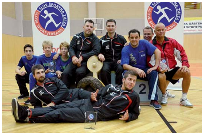
Zmagovalci 1. Pokala Julijskih Alp (NTK Križe) s spominskim prehodnim pokalom Die Gewinner des 1. Pokals der Julischen Alpen (TTK Križe) mit dem Wanderpokal