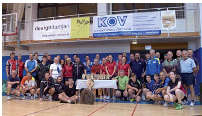
Skupinska slika 2. Pokala Julijskih Alp Gruppenbild des 2. Pokals der Julischen Alpen

Za 2. Pokal Julijskih Alp so se predstavniki Slovenije in Avstrije dogovorili o novem načinu ekipnega tekmovanja. Ekipo so po novem sestavljali štirje igralci, lahko mešano po spolu in starosti. Najprej se je igralo tekmo dvojic in nato sta sledili še dve posamični temi. Tako je bil končni rezultat 3 : 0 ali 2 : 1. Vsak tekmovalci je lahko nastopil le v eni tekmi dvoboja. Ta sis-