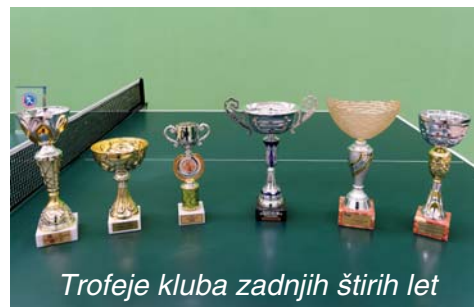
Trofeje kluba zadnjih štirih let

let, dekleta pa v Radovljiški rekreacijski ligi. Uspešni smo bili tudi v Gorenjski ligi in Občinski ligi.