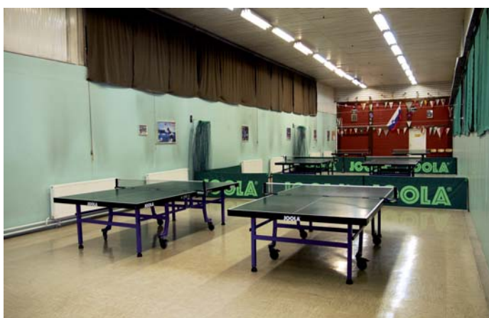
Namiznoteniška dvorana v Hali Podmežakla