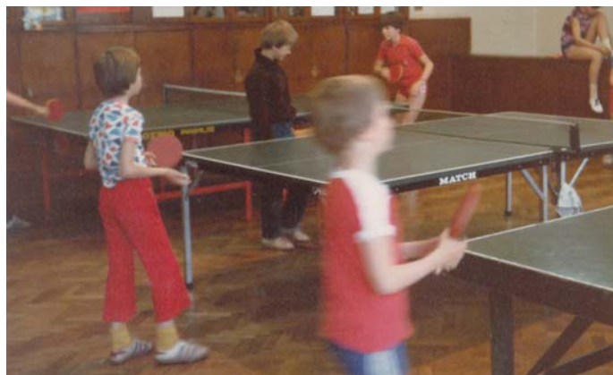
TVD Partizan Jesenice